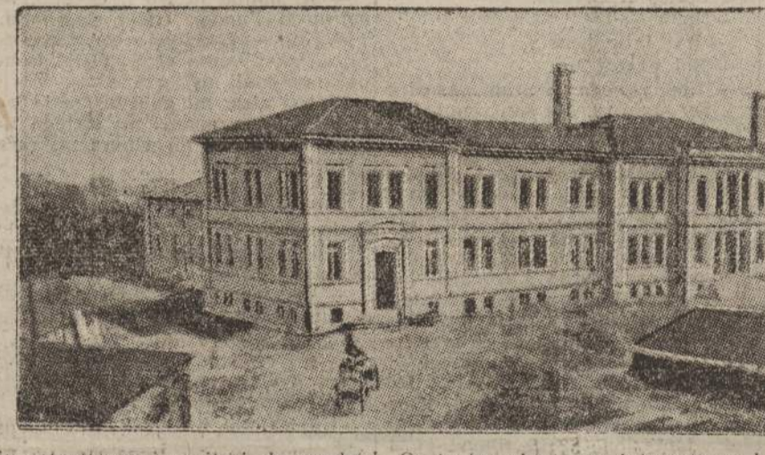
La nuova sede dell'Orfanotrofo femminile di S. Leonardo