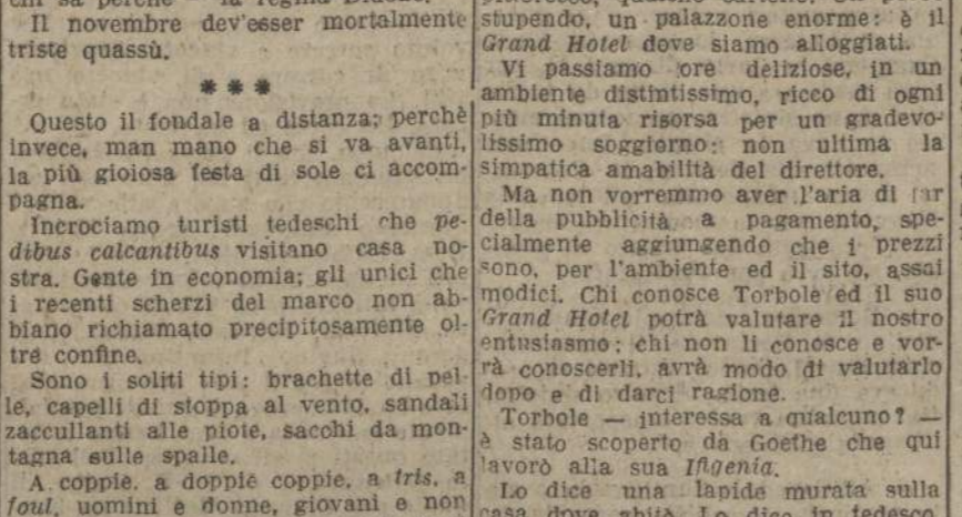
...A coppie, a doppie coppie, a tri...