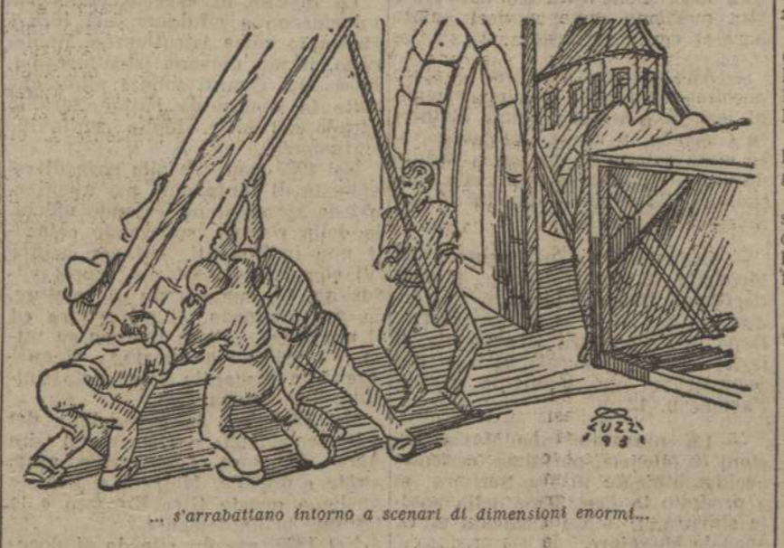
...s'arrabattano intorno a scenari di dimensioni enormi...

La cerimonia ha avuto luogo nel giardino dell'aeroporto del Littorio, alla presenza di un folto stuolo di ufficiali superiori dell'Aeronautica, fra i quali erano il capo di S. M. generale Valle... il comandante della zona generale Lombardi.