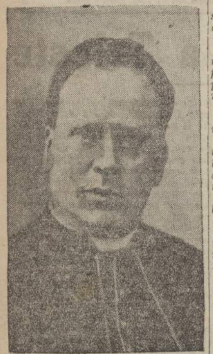
sole confidente. Talvolta, ancor di più; i giovani, che bevevano la fiamma dei suoi occhi, lo sollevavano in un trionfo chiassoso pieno di affetto e di prepotenza.

Riposi nel suo premio e nella sua gioia... Fu un capitano, fu un apostolo. Ha compiuto degnamente la propria giornata.