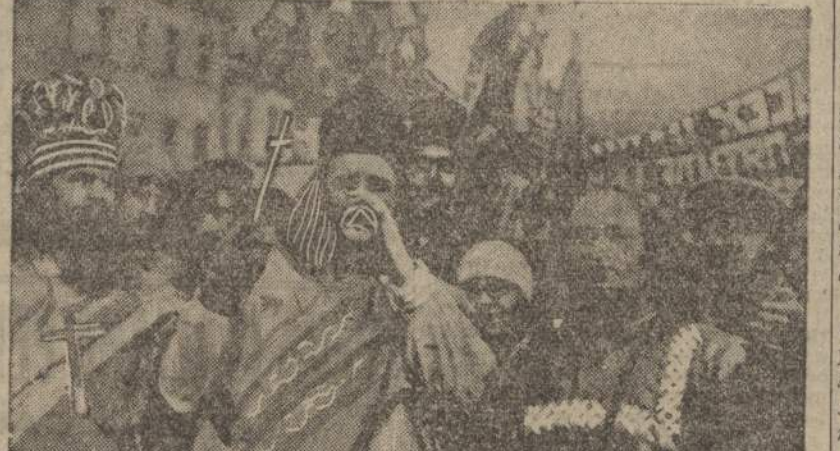
Uno dei blasfemi e ridicoli cortei: gli studenti universitari di Mosca, mascherati da preti in processione, in segno di scherno.

procedi del lavoro si è compiuto durante il giorno di Natale — anti-co stile — nel modo consueto. La percentuale delle defezioni e del lavoro si è notato un adempimento più perfetto dei giorni ordinari. Ma l'unanimità delle presenze e il numero dei telegrammi che la confermano bastano a provare le pressioni formidabili e odiose che avevano ottenuto tali risultati. Un telegramma di Lugansk, del 7 gennaio, recato dal medesimo numero delle «Isvestia», svela ingenuamente la manovra: