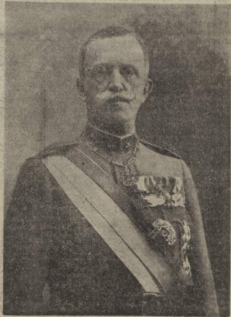
Re Vittorio Emanuele III

L'ambasciatore di Francia presso la S. Sede a Palazzo Primosibano, dopo la firma dei trattati a Palazzo Lateranense ha inabberato la bandiera in segno di compiacimento.