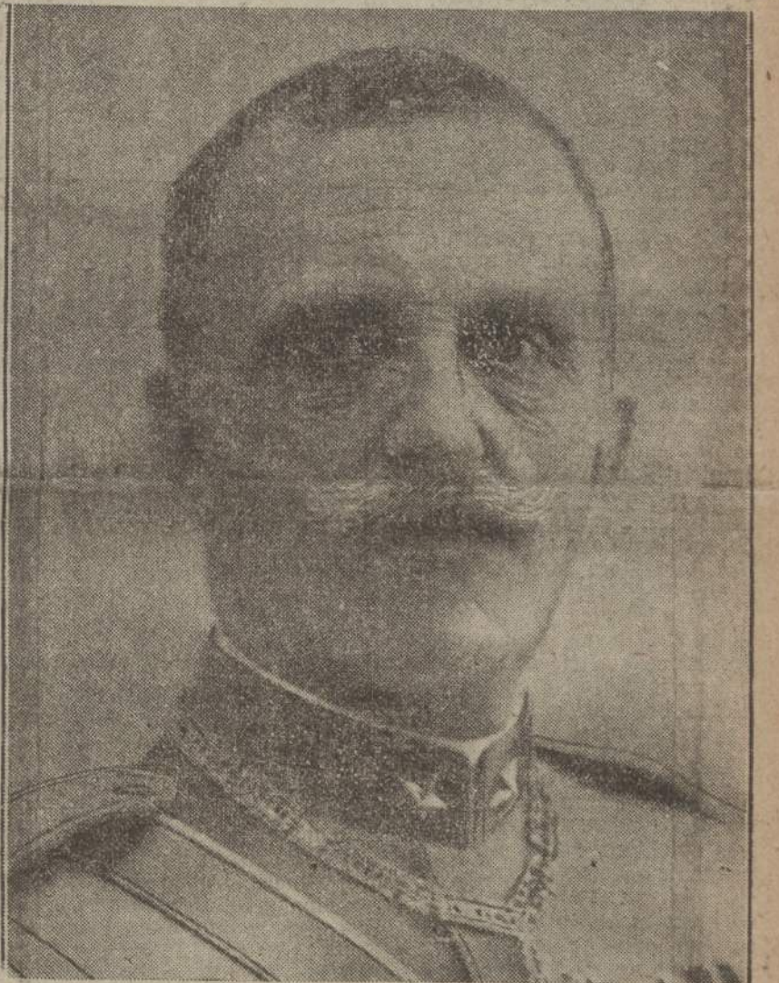
Re Vittorio Emanuele III

tutta la provincia romana. Tutta Roma si prepara a una grandiosa manifestazione di entusiasmo felicissimo, il più grande che essa ricordi da secoli.