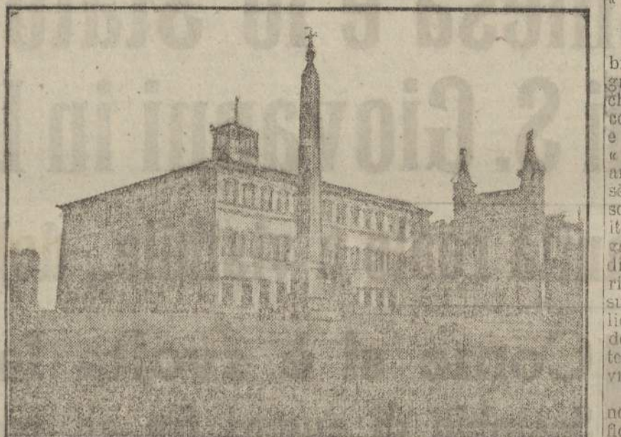
Il Palazzo Apostolico di S. Giovanni in Laterano nella cui storica Sala dei Papi S. E. il Cardinal Gasparri e S. E. Benito Mussolini si sono incontrati stamane per la firma dell'atto di conciliazione.