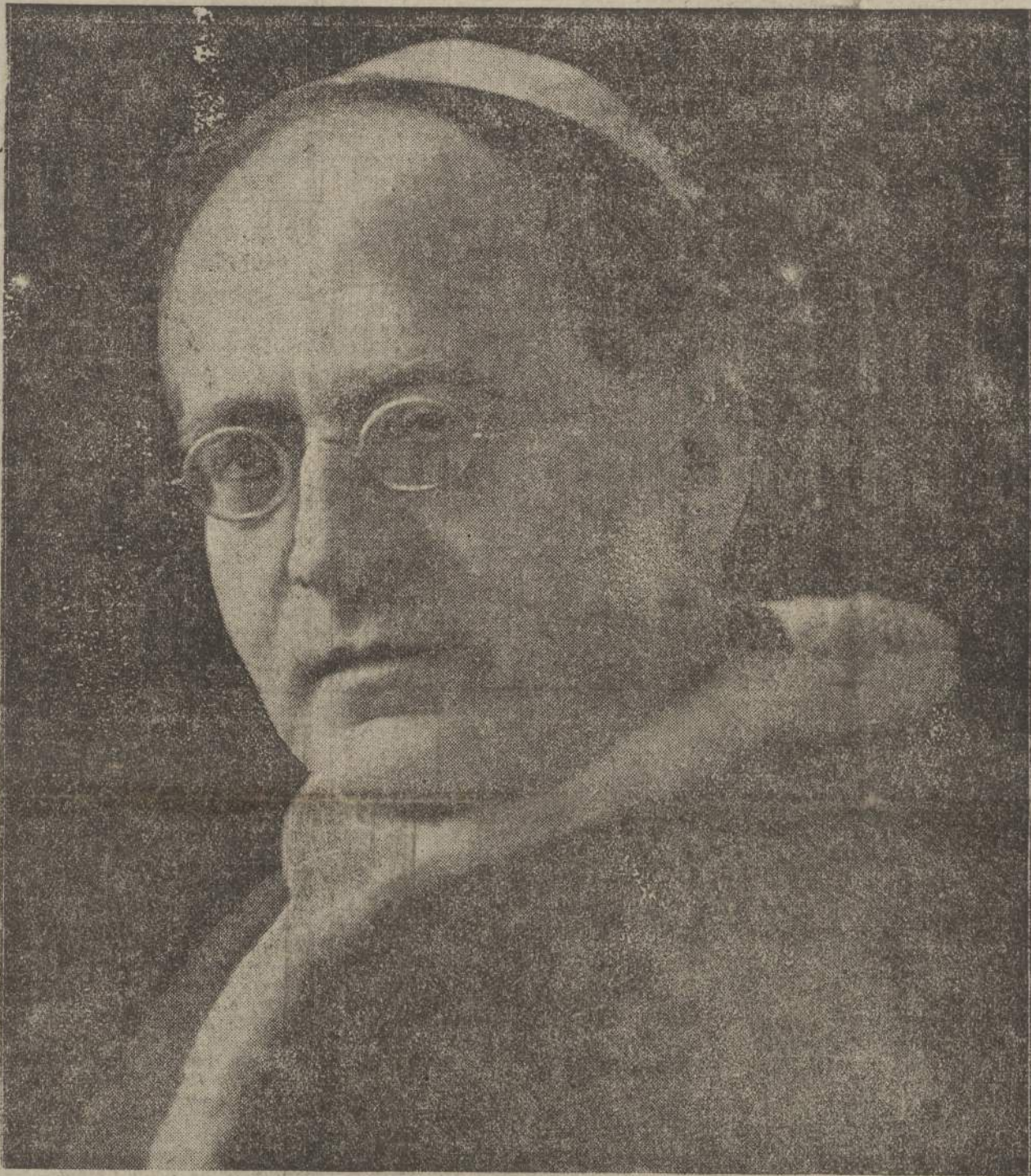
SUA SANTITÀ PIO XI

Il gesto ormai è avvenuto. L'annuncio che percorre liberamente l'Italia dall'Alpi al mare - ieri sussurrato appena, raccolto poi con trepidazione quasi incredula e quindi fattosi vibrante di gioia incontenibile - è qui dinanzi a noi e si fissa nel fondo luminoso del cuore.