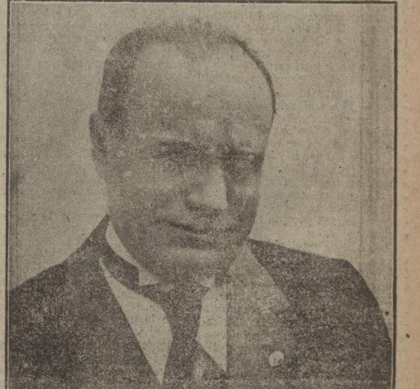
S. E. Benito Mussolini, Capo del Governo d'Italia, che ha firmato l'atto di conciliazione fra lo Stato italiano e la Santa Sede